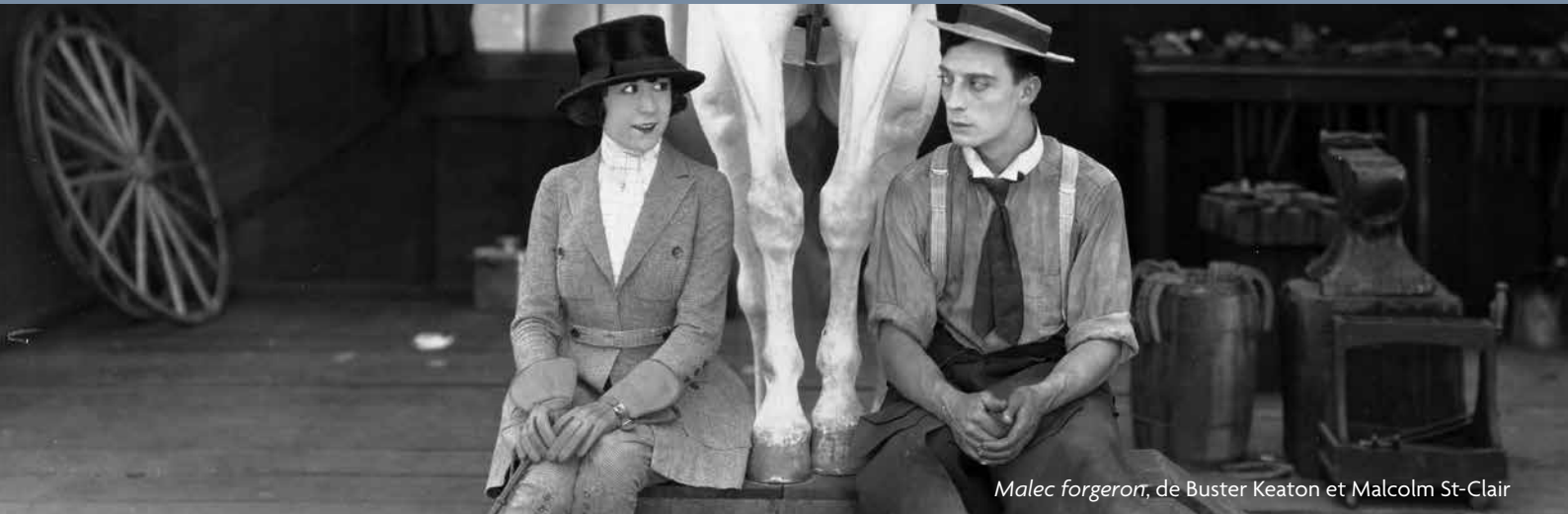
Malec forgeron , de Buster Keaton et Malcolm St-Clair

Cet atelier a pour objectif de présenter aux élèves le cinéma burlesque, la manière si particulière qu'ont les acteurs de bouger leur corps dans l'espace et d'explorer différentes manières de jouer la comédie.